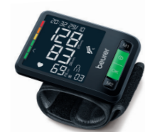
BC 87 Page 133