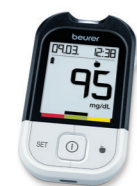
GL 48 Page 142