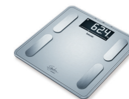
BF 405 SignatureLine Page 32