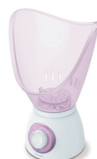
FS 60 Page 215