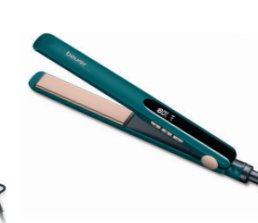
HS 50 Ocean Page 228