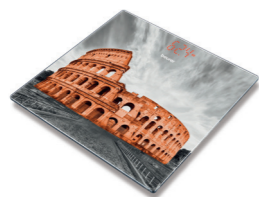
GS 215 Rome Page 41