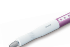
MP 52 Page 199