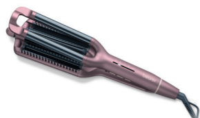
HT 65 Page 233