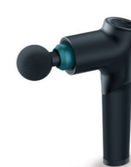
MG 185 Page 110