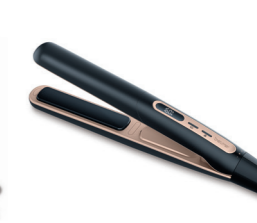
HS 100 Page 229