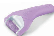
MP 59 Page 205