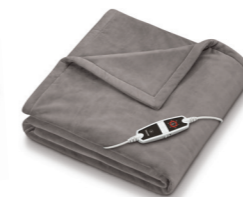
HD 150 XXL Cosy Taupe Page 27