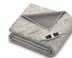
HD 150 XXL Nordic Taupe Page 27