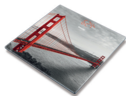
GS 215 San Francisco Page 41