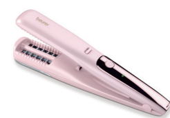
HT 22 Page 231