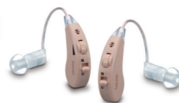
HA 55 Pair Page 171