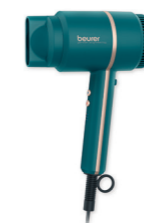
HC 35 Ocean Page 225