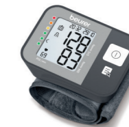
BC 27 Page 130