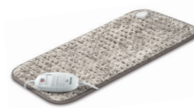
HK 123 XXL Nordic Taupe Page 17