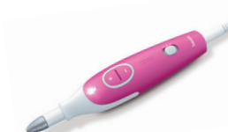
MP 44 Page 198