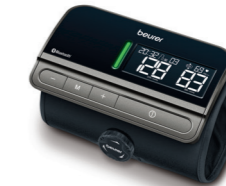
BM 81 easyLock Page 128