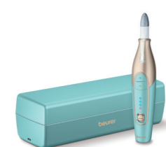
MP 84 Page 201