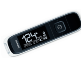
GL 60 Bluetooth* Page 143