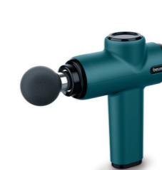
MG 99 Page 110