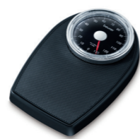
MS 40 Page 46