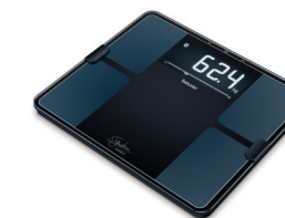
BF 915 SignatureLine Page 33