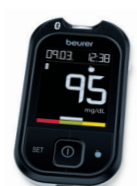
GL 49 Bluetooth* Page 142