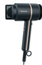
HC 35 Page 224