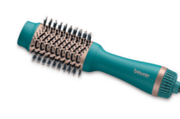
HC 45 Ocean Page 225